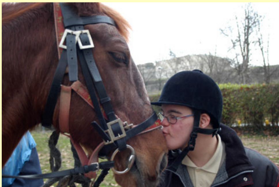
Equinoterapia en el colegio El Molino

Actividades: La historia del caballo, hipología básica, cuidados del caballo, nociones básicas de equitación.