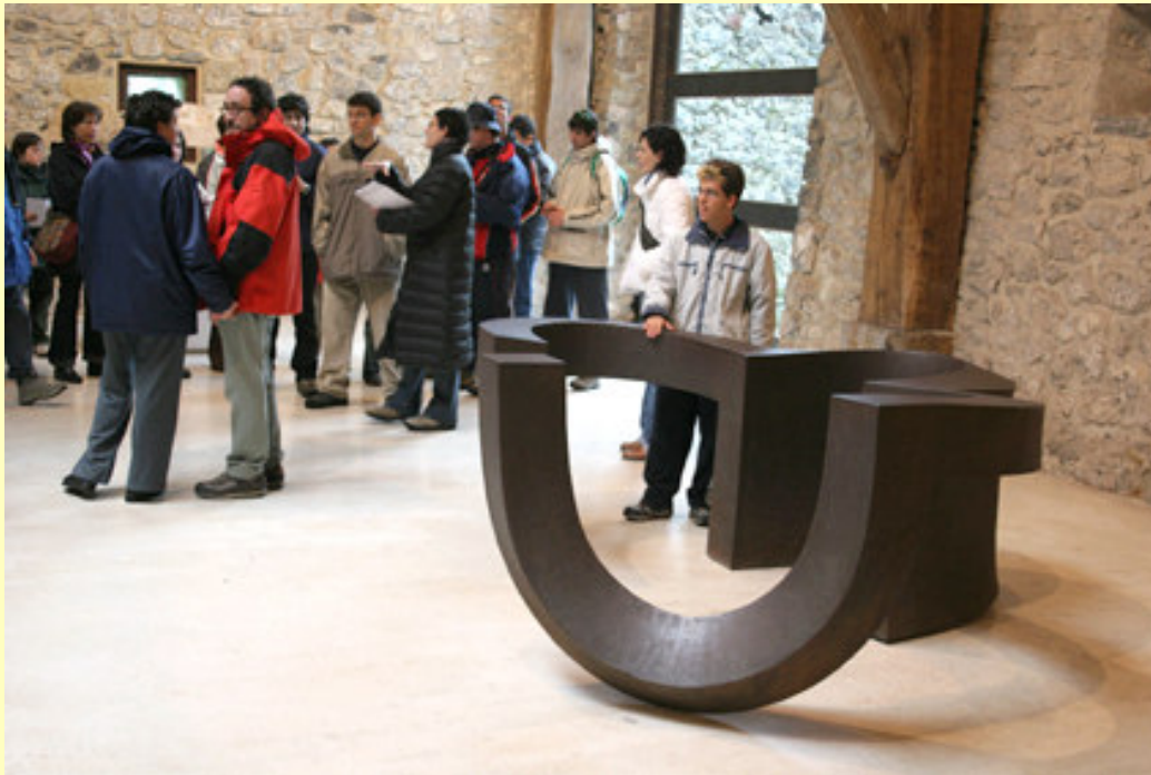
Alumnos visitando la escultura de la Tolerancia. Obra de Eduardo Chillida.

La educación no ha de ir dirigida a las personas con discapacidad intelectual sino también al entorno en que desarrollan su existencia, para que se puedan dar los apoyos oportunos en cada momento. Pensamos que la familia es el medio privilegiado para el desarrollo afectivo de su hijo. Podríamos considerarla como una unidad terapéutica.