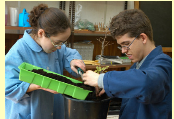
Dos alumnos trabajan en el taller de huerta.